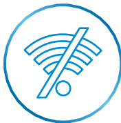
Offline statt online