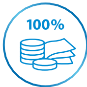
100 % Zahlungsgarantie

Auch die Sicherheit ist ein Vorteil: Da Prepaid-Funktionen guthabenbasierte Bezahlverfahren sind, kann lediglich das Geld ausgegeben werden, das im Vorfeld einer Zahlung auf den Chip geladen wurde. Für Händler ist die Zahlung garantiert und läuft komplett offline ab, was weniger technische Infrastruktur nötig macht, deutlich günstiger ausfällt und somit besonders für Automatenbetreiber und kleinere Akzeptanten ein deutliches Plus darstellt. Äußerst günstige Konditionen machen die Prepaid-Systeme zu einer sehr wirtschaftlichen Variante für Händler. Der Verbraucher hat im Gegenzug die maximale Kontrolle über sein Guthaben und genießt eine schnelle, bequeme und hygienische Bezahlung.